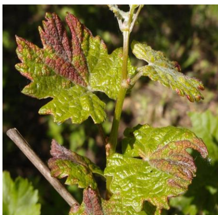
b) Živočišní škůdci

V současné době není třeba porosty ošetřovat.